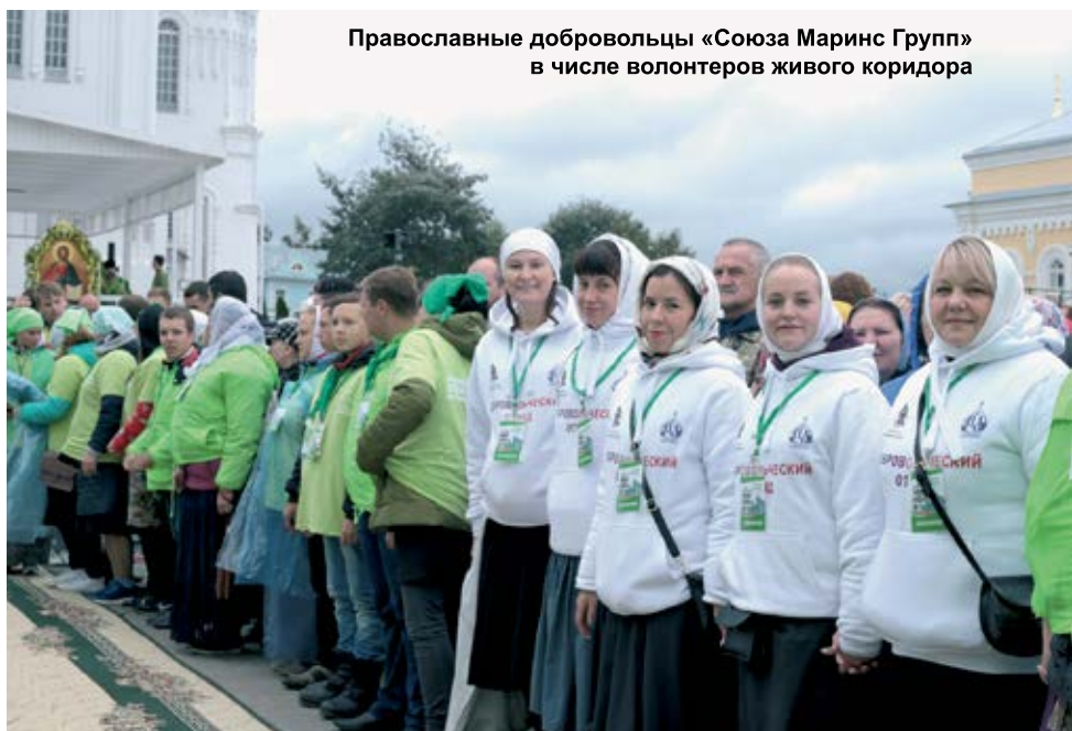
Православные добровольцы «Союза Маринс Групп» в числе волонтеров живого коридора

Ольга НОВИКОВА