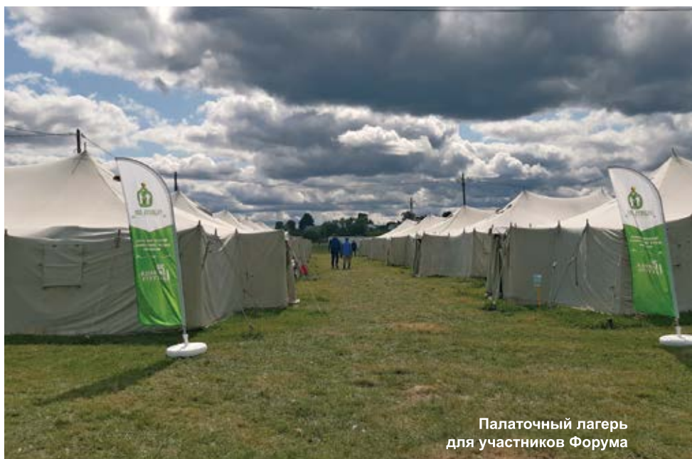
Палаточный лагерь для участников Форума

Утром 1 августа десятки тысяч паломников собрались славить чудотворные деяния Серафима Саровского в четвертом уделе Богородицы – на соборной площади Свято-Троицкого Се-