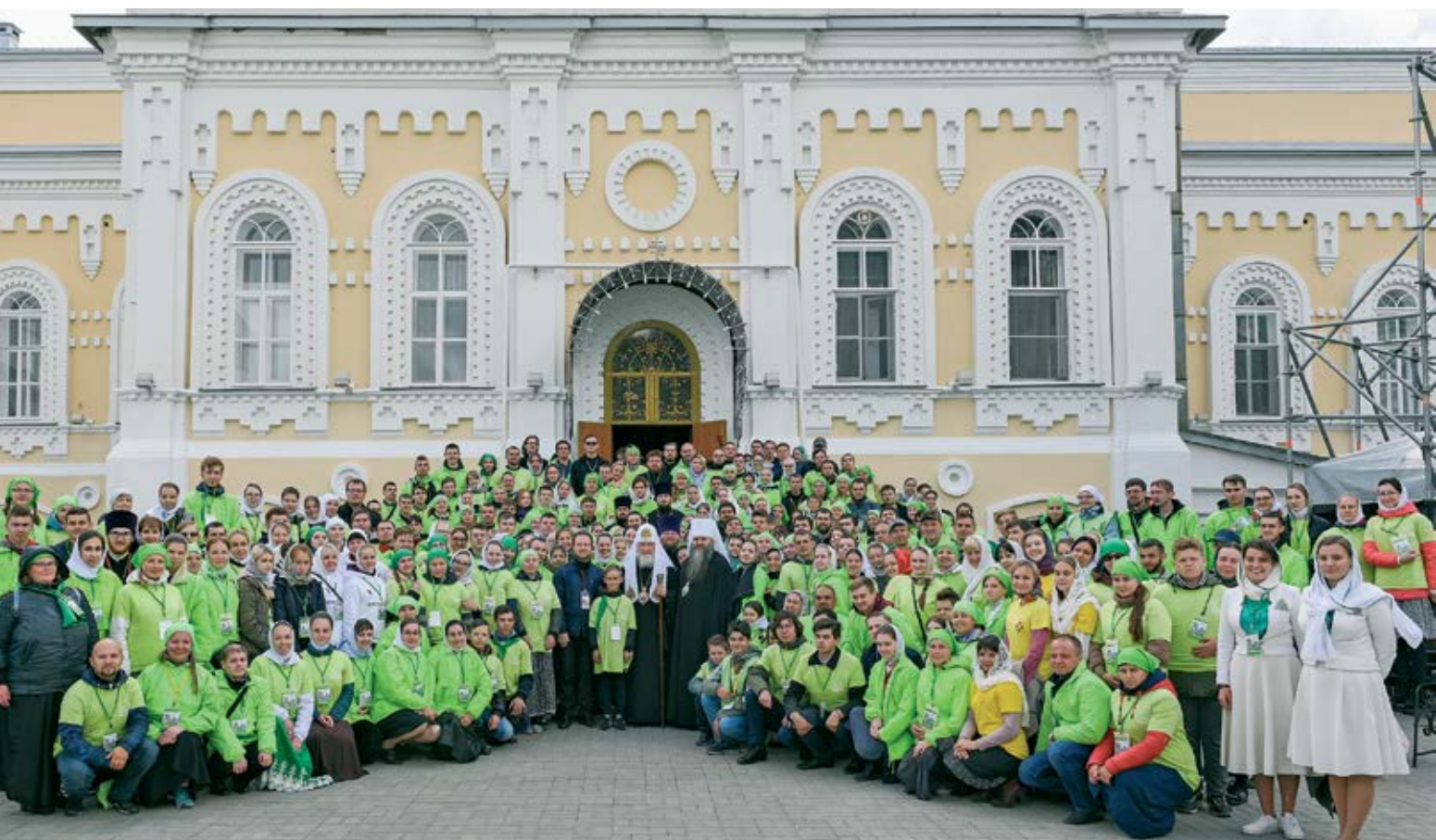
Святейший Патриарх Московский и всея Руси Кирилл с добровольцами