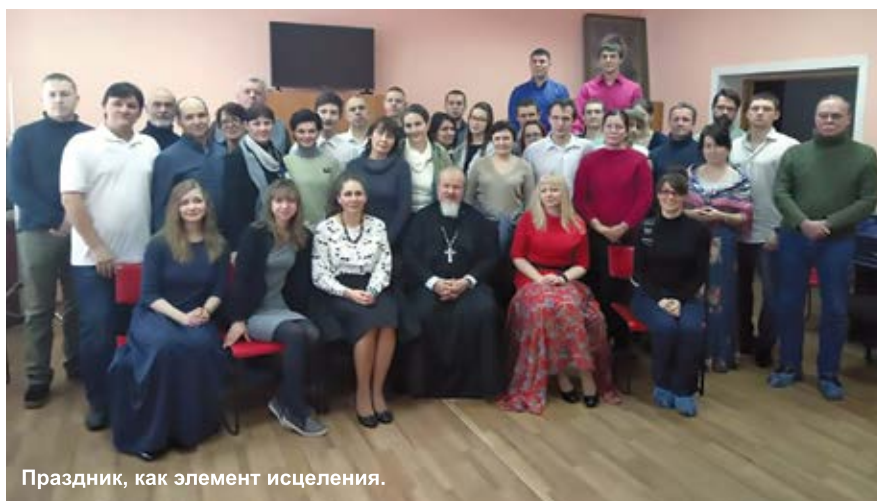
Праздник, как элемент исцеления.