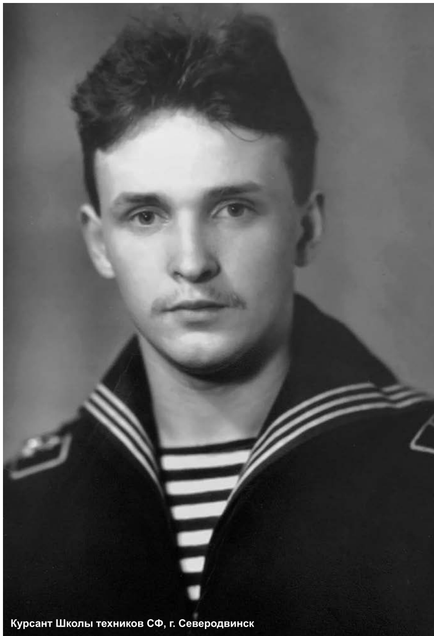
Курсант Школы техников СФ, г. Северодвинск