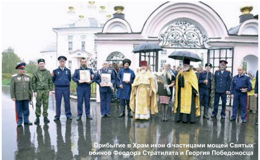
Прибытие в Храм икон с частицами мощей Святых воинов Феодора Стратилата и Георгия Победоносца